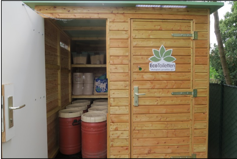
ähnliche Abbildung mit anderen Grundmaßen und ohne Rampe. Hier kann man sich ein gutes Bild machen von den Materialien.