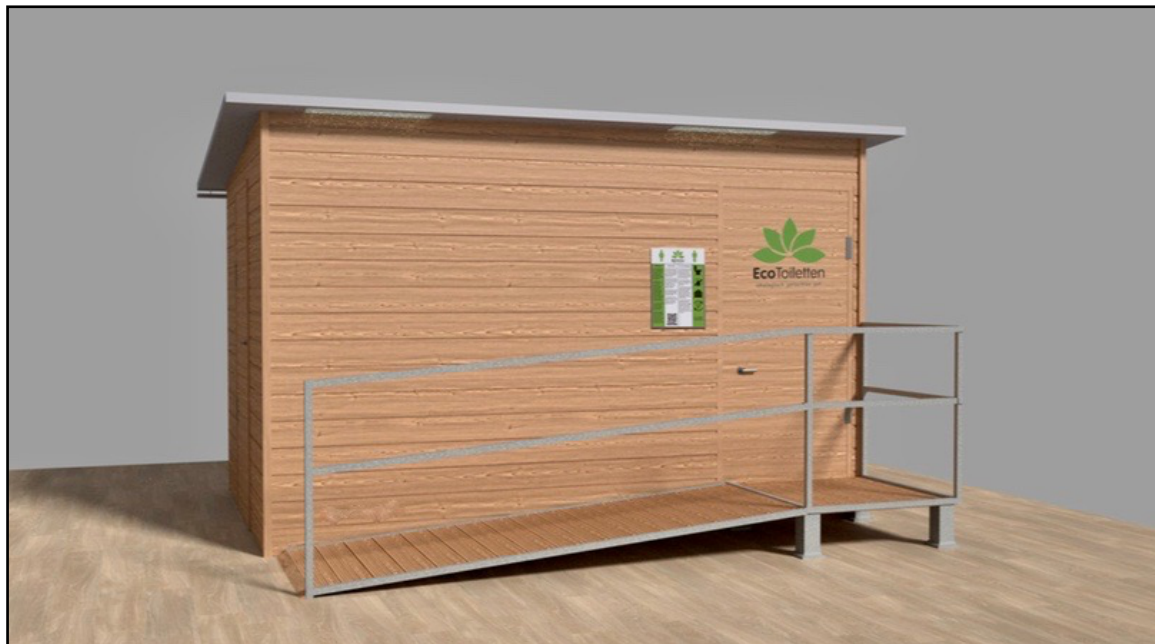
Rendering zur Aufteilung der Toilette. Links befindet sich der Zugang zum Serviceraum.